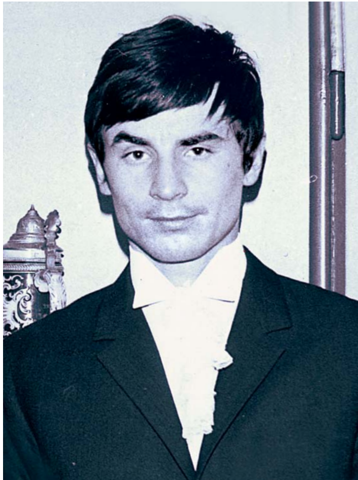
TEHDY ERWIN VAN HAARLEM... Tento muž byl pro celý svět znám jako špion Erwin van Haarlem.

win van Haarlem působil od roku 1975 a své poslání jsem úspěšně plnil až do dubna 1988. Teprve pak mě zatkla britská policie a o rok později mě soud poslal za špiónáž na deset let do vězení,” vypráví Jelínek.