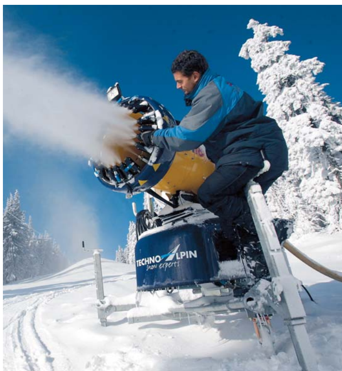
UMĚLÝ SNÍH. Technik včera zasněžoval sjezdovku na Černé hoře v Krkonoších. Lyžařská sezona se rozbíhá.

Narozdíl od řidičů mohou mít ze zimního počasí radost návštěvníci hor – řadu sjezdovek už provozovatelé zasněžují a například v krušnohorském Božím Daru bude o víkendu v provozu dětská sjezdovka včetně vleku.