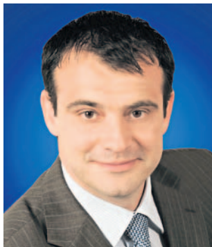
Zavražděn Politik byl neznámý od začátku září.

Ještě ve středu zasahová jednotka v Rouchovanech na Třebíčsku